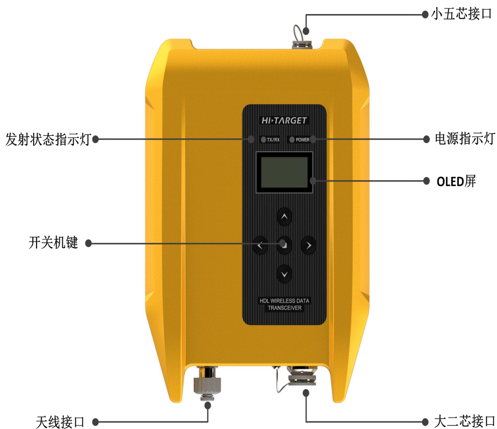
图 1 正面视图